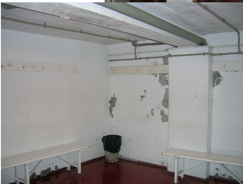
Foto 6 Detalle do estado dos tabiques dos vestiarios.