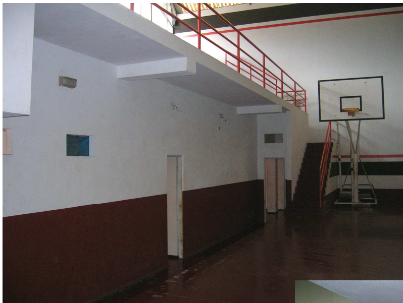
Foto 1 Fachada dos vestiarios á zona de xogo.