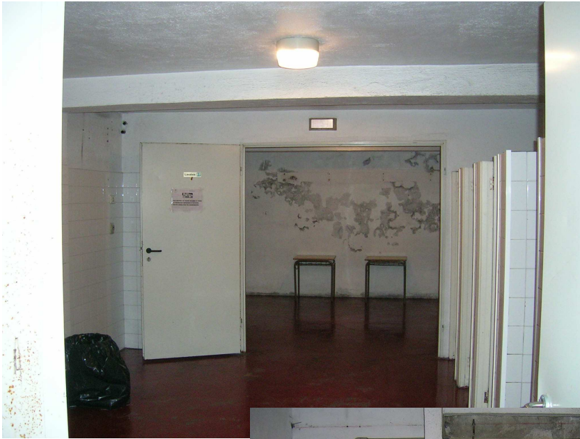
Foto 4 Vista interior do estado actual dos vestiarios. Obsérvase o estado do pavimento e dalgunhas paredes, con importantes humidades.