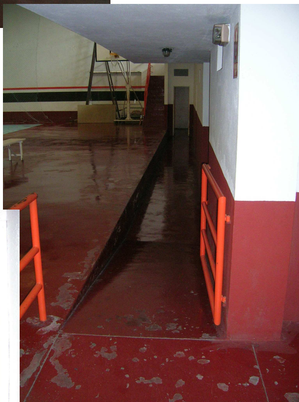
Foto 2 Vista do acceso aos vestiarios mediante unha rampa. Obsérvase o desnivel existente entre a zona de xogo e os vestiarios.