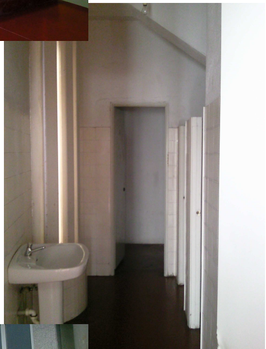
Foto 11 Aseos femininos na planta de acceso, destinados ao público.