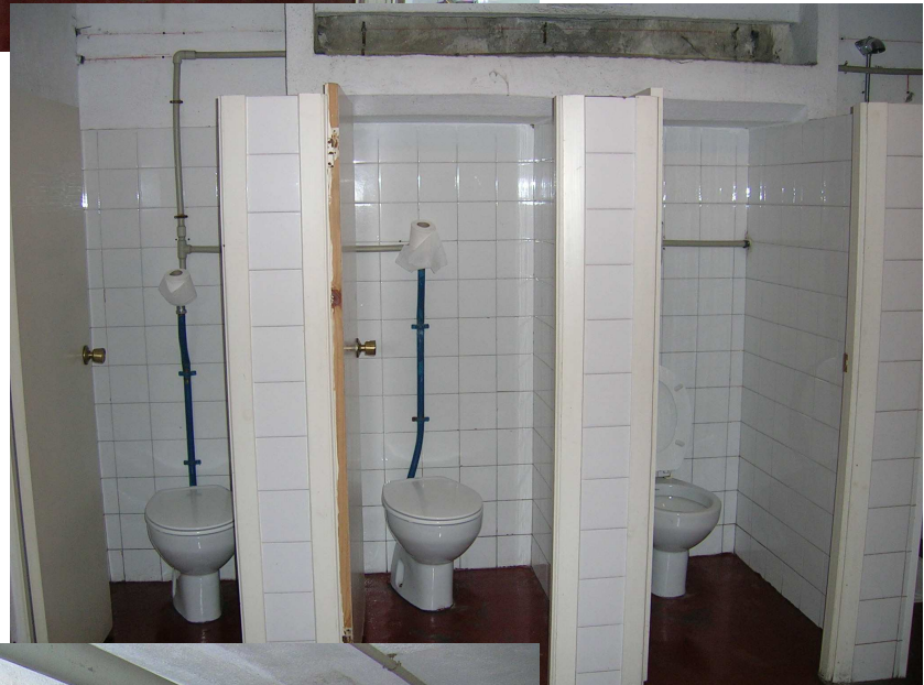
Foto 5 Vista das cabinas de inodoros e duchas.