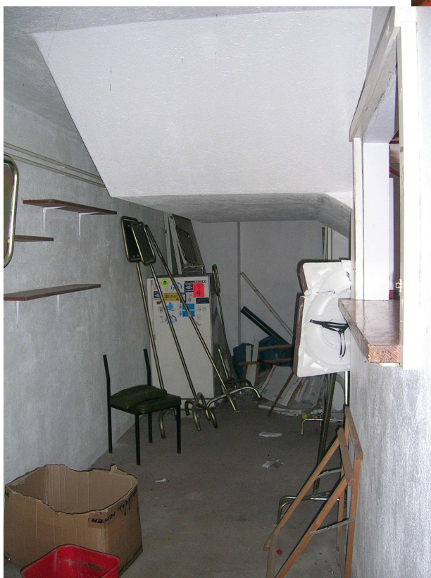
Foto 3 Espazo de almacenamento baixo a escaleira principal.