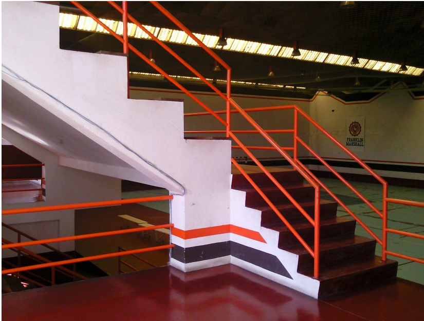
Foto 10 Espazo no que estaría previsto, no futuro, a instalación dun ascensor.