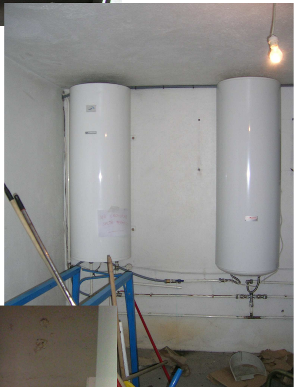
Foto 8 Vista da instalación de auga quente.