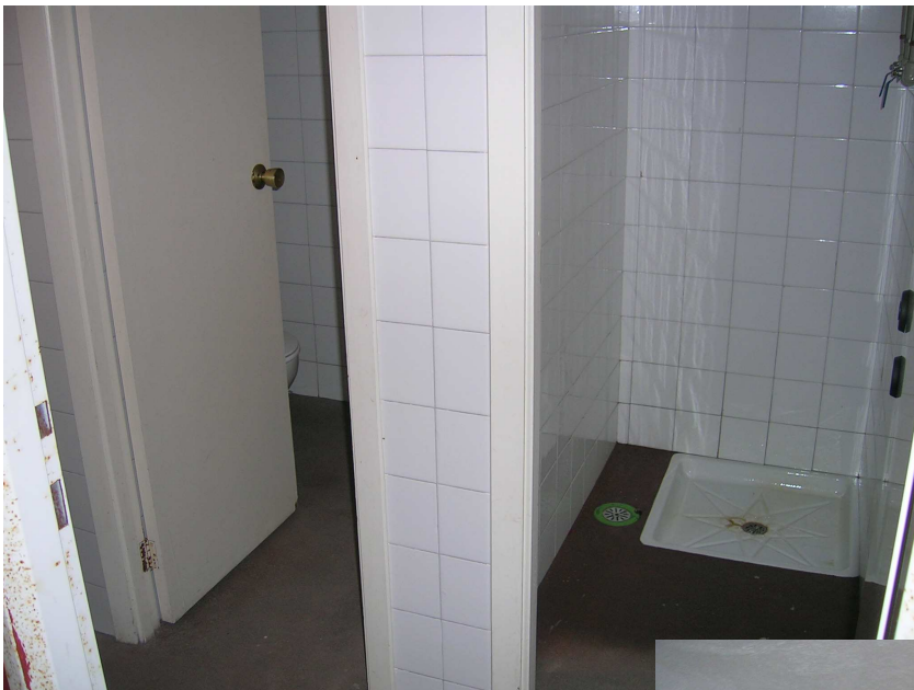
Foto 7 Vista dos vestiarios de árbitros.