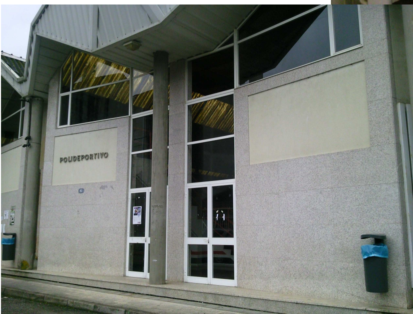
Foto 12 Vista da fachada principal, onde se proxecta modificar as portas de acceso.