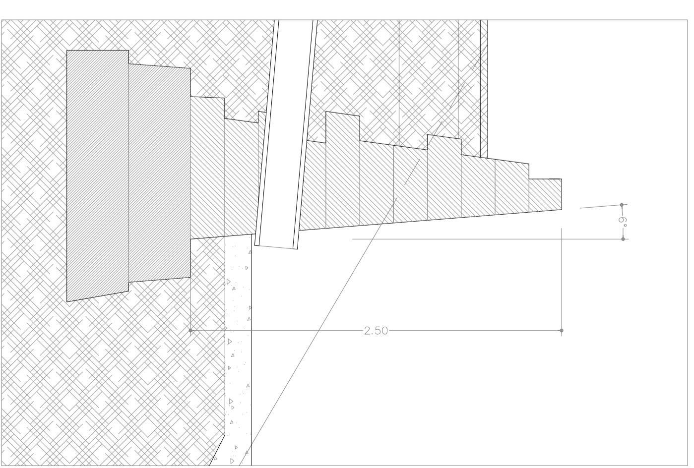
DETALLE DE MURO DE CONTENCIÓN