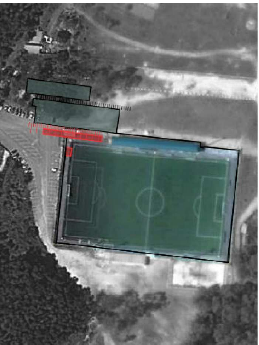
EMPLAZAMIENTO sin escala