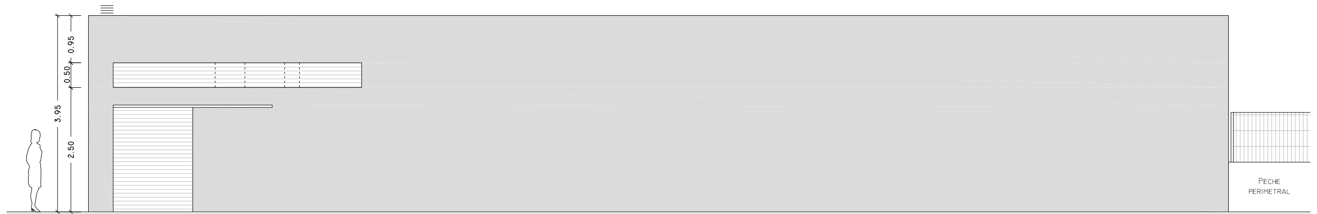
ALZADO SUR 1/75