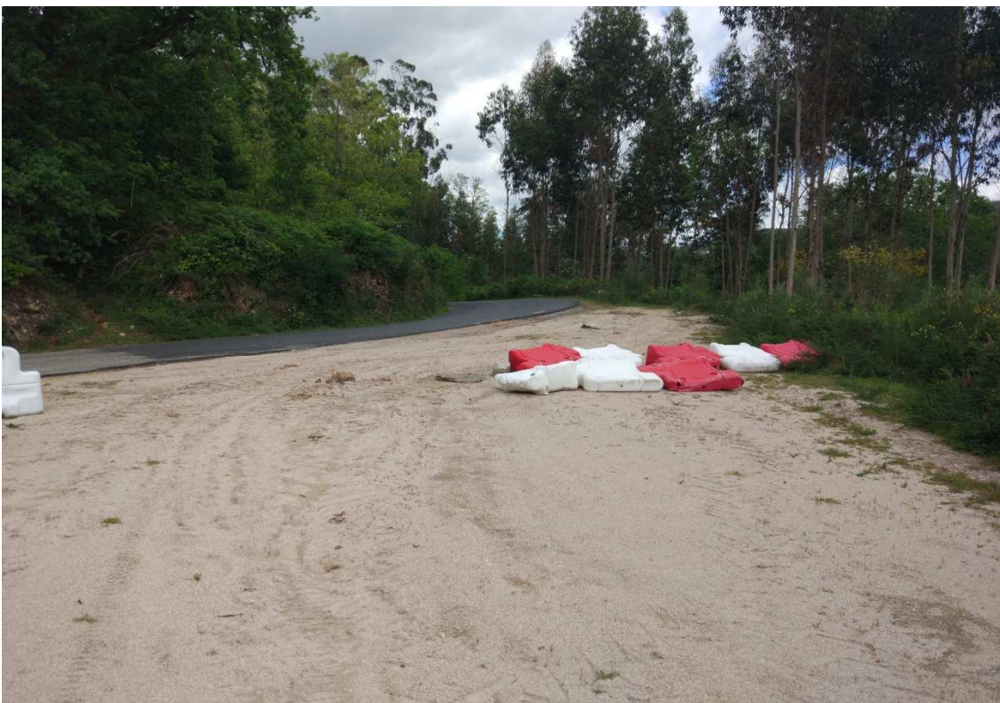
Foto 10. P.K.1+890. Fin da variante en xabre de 10 metros de ancho existente na actualidade.