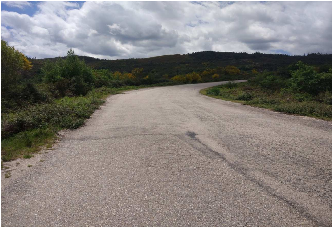
Foto 4. P.K.0+600. Detalle da plataforma de 9 metros existente na actualidade.