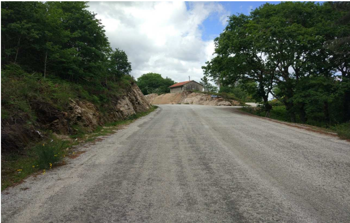
Foto 5. P.K.1+200. Detalle da plataforma de 9 metros existente na actualidade.