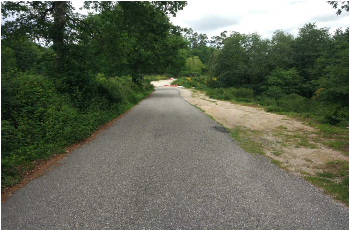
Foto 7. P.K.1+740. Zona de saneo e ensanche no acceso a variante.