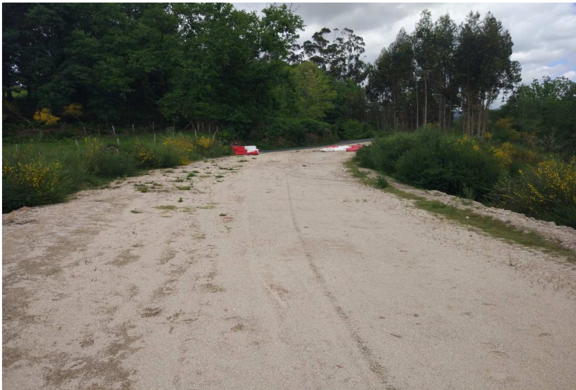
Foto 9. P.K.1+850. Variante en xabre de 10 metros de ancho existente na actualidade.