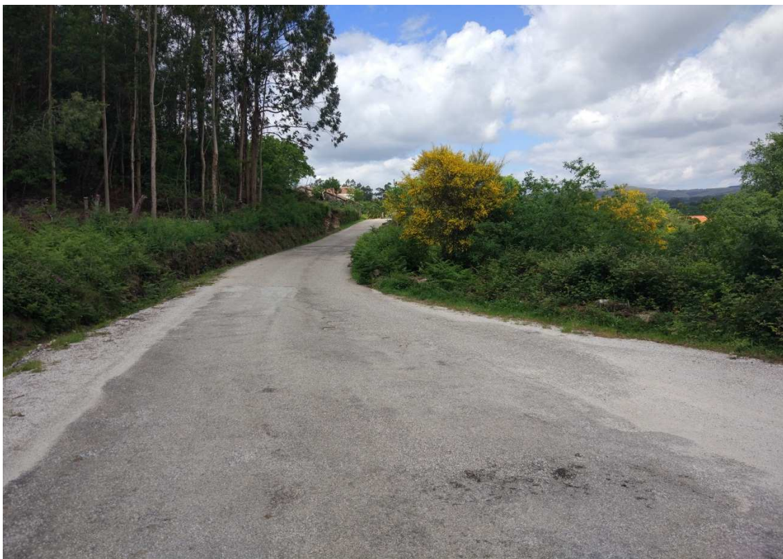
Foto 6. P.K.1+440. Estreitamento puntual por existencia de núcleo de vivendas.