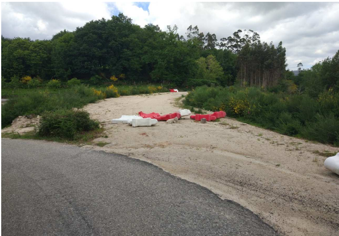
Foto 8. P.K.1+800. Inicio da variante en xabre de 10 metros de ancho existente na actualidade.