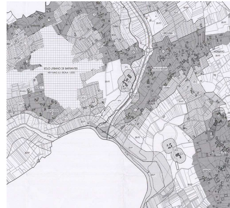
Elemento do patrimonio arquitectónico e arqueolóxico catalogado no PXOM de Ribadumia