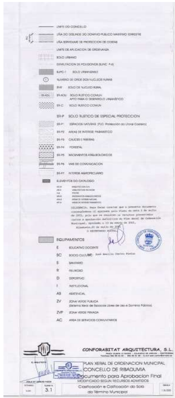
Plan Xeral de Ordenación Municipal vixente aprobado con data de 13/03/2001.