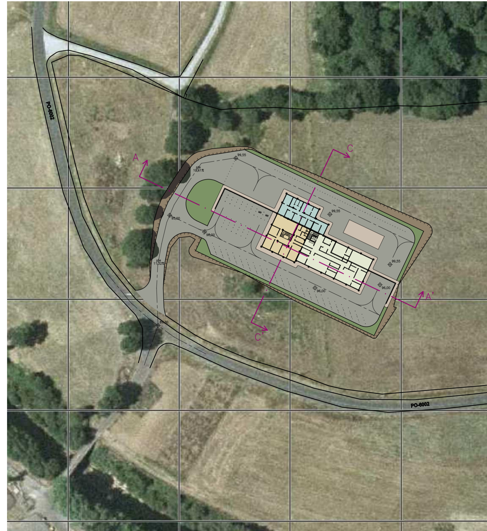
IMPLANTACIÓN EN PARCELA Esc.: 1/1000