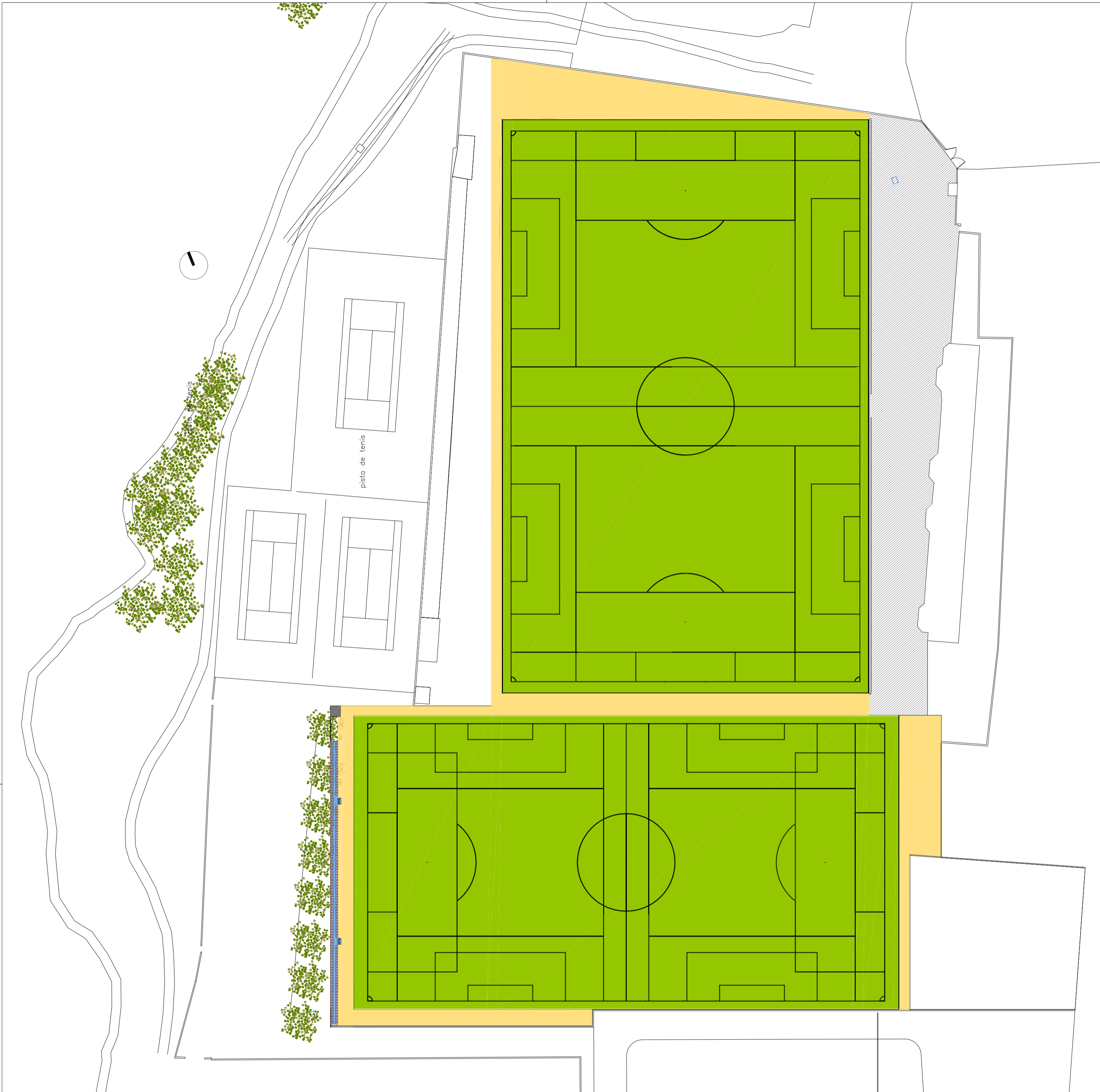
ESTADO ACTUAL ESCALA 1:500